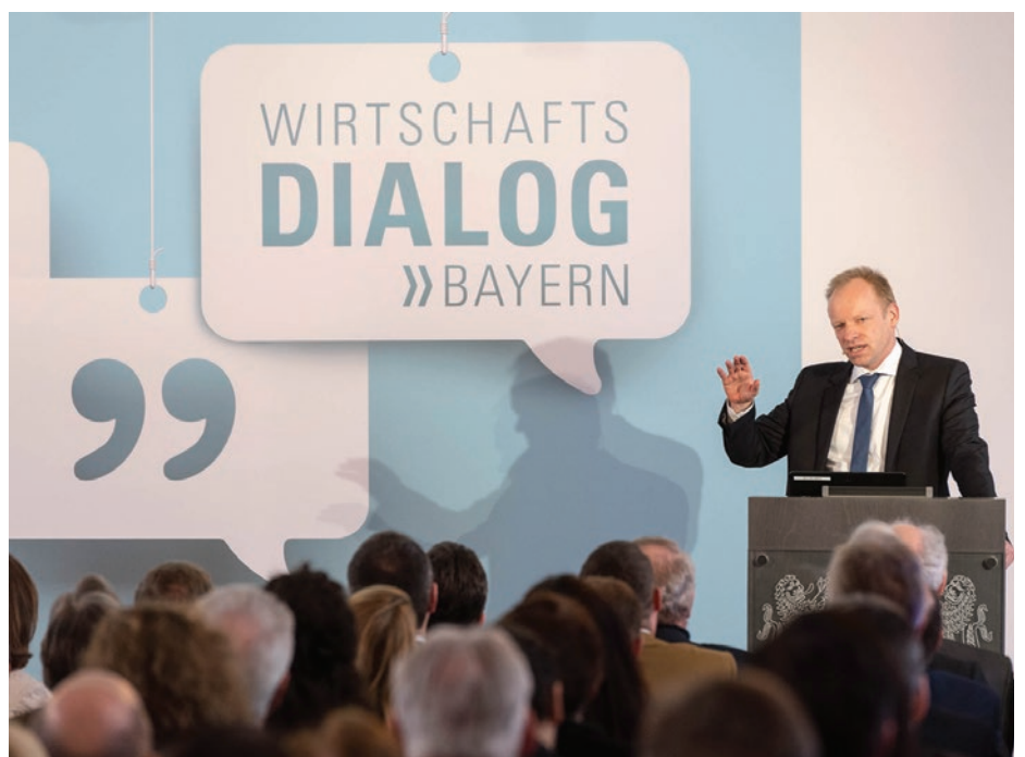
Prof. Dr. Clemens Fuest: »Wirtschaftspolitische Herausforderungen für den Standort Bayern«

Bei der anschließenden Diskussion ging es darum, welche Antworten Politik und Wirtschaft auf diese Herausforderungen geben können. Von den 400 Gästen war zu hören, dass sie auf die wirtschaftliche Lage vertrauen und es viel Arbeit gibt – das Problem jedoch »genügend Personal« heißt. Die Politik nimmt die neuen Herausforderungen ernst und setzt Anreize für zusätzliche Investitionen in Forschung und Entwicklung. Digitalisierung sei dabei das »Megathema« schlechthin.