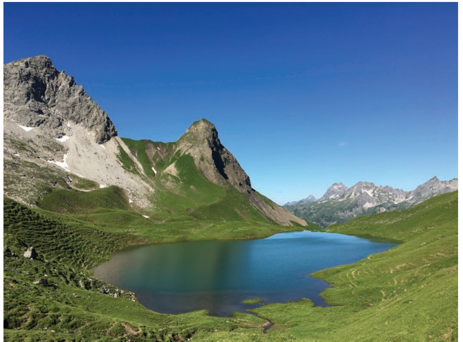
Intakte Natur – der Rappensee bei Oberstdorf ist der südlichste See Deutschlands

wurde dieses Engagement und der konsequente Einsatz honoriert. 2014 wurden wir für 10 Jahre QuB-Zertifizierung mit der Ehrenurkunde der Handwerkskammer Schwaben geehrt.