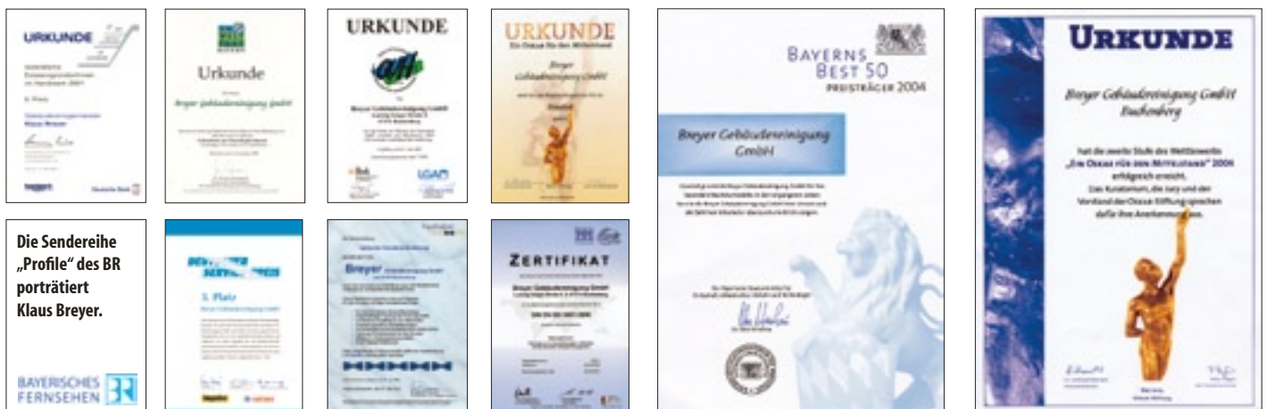
Auszeichnungen aus den Jahrgängen 1999-2003